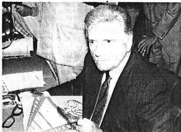
Sergio Zavoli sarà a Positano a settembre

Gli appuntamenti con la cultura si concluderanno l'8 settembre con il «principe del giornalismo televisivo», Sergio Zavoli, autore del saggio